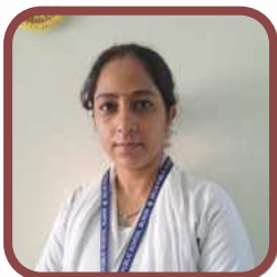
MS. NIKKI (Nurse)