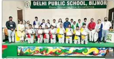
विजेताओं को प्रमाण पत्र देते।

इस प्रतियोगिता में स्कूल के चार हाउस समूह थे जिनमें, गो गेटर्स, वेब राइडर्स और गोल एक्वेक्स हाउस के विद्यार्थी शामिल हुए और अपने ज्ञान का प्रदर्शन किया। प्रतियोगिता में चार राउंड हुए। पहला राउंड, टीम वेब राइडर्स था। इसमें प्रतिभागियों ने टीम से सम्बंधित प्रश्नों के जवाब देना पड़ा। दूसरा राउंड गोल एक्वेक्स हाउस से हुए। इसमें छात्रों ने सांख्यिक और गणित के जवाब दिए। तीसरा राउंड गेटर्स हाउस से हुआ। एक मातृवर्ण्य प्रश्न था, इसमें प्रतिभागियों को तेज संघर्ष, ज्ञान के ज्ञान की गहराई और एक मंच पर प्रदर्शन प्रतियोगिता के लिए तैयार होना पड़ा।