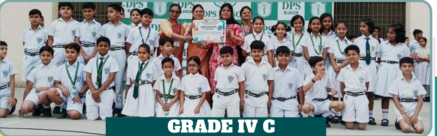
GRADE IV C