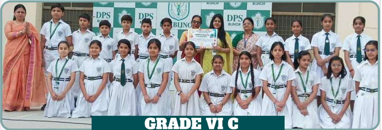
GRADE VI C