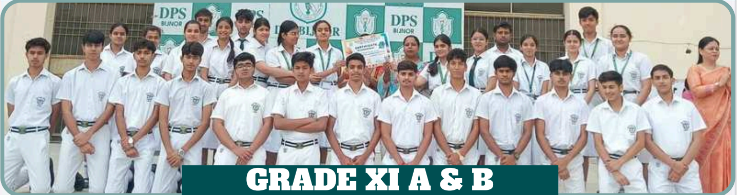
GRADE XI A & B