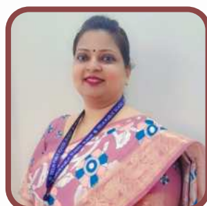
MS. KAJAL AGARWAL