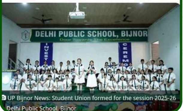
UP Bijnor News: Student Union formed for the session 2025-26 Delhi Public School, Bijnor