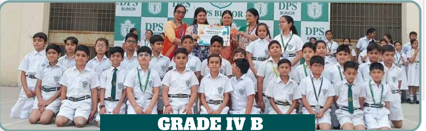
GRADE IV B